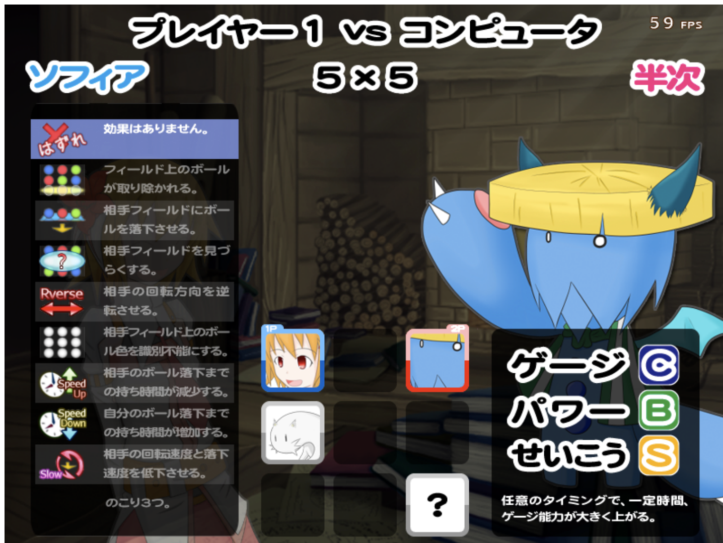
図 4.キャラクター選択画面

任意のキャラクターを選び、続いてスロットに設定する効果、ゲーム背景を選択し、ゲームを開始します。