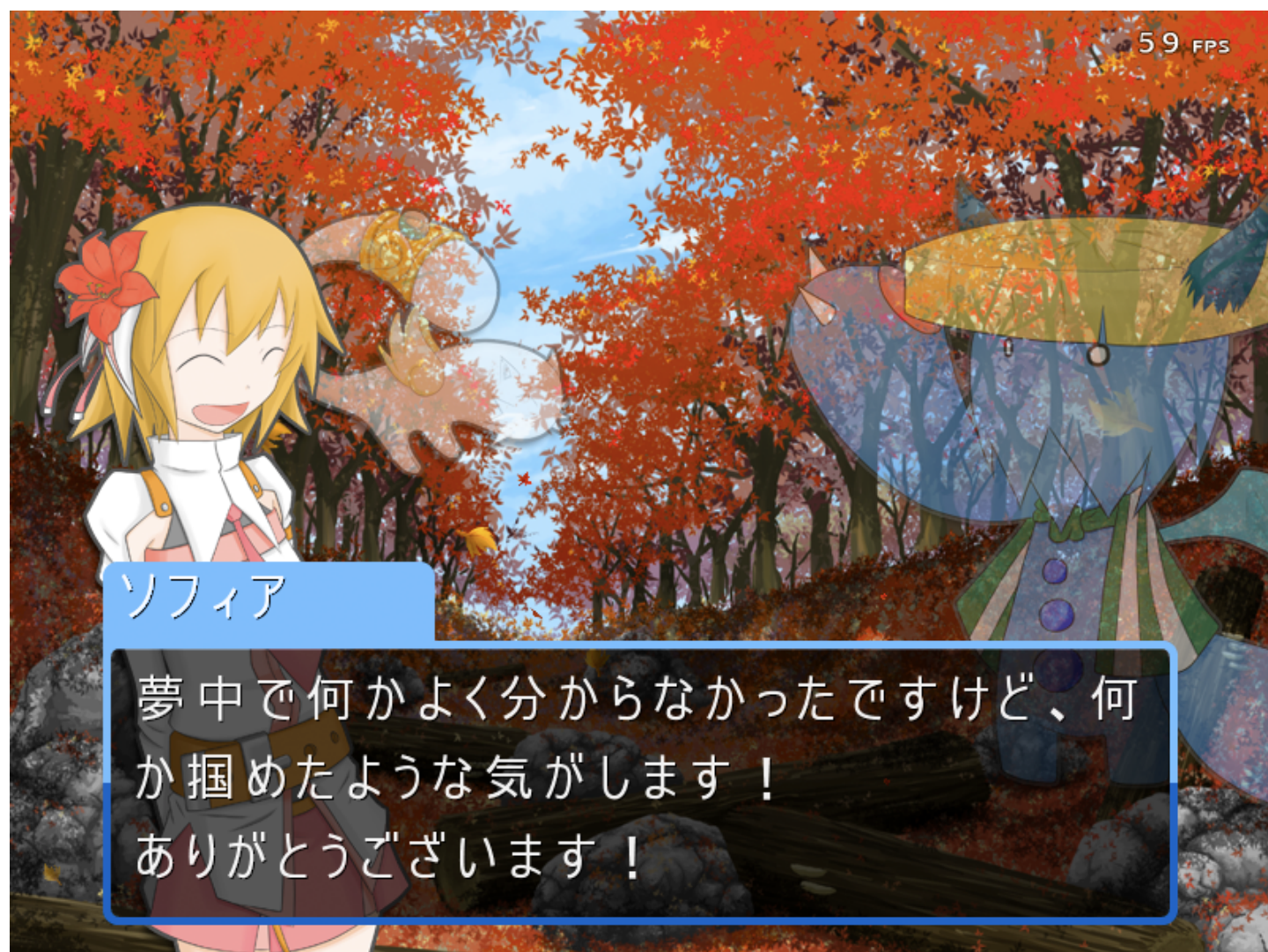
図 2.アドベンチャー画面